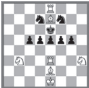
Wit geeft mat in 2