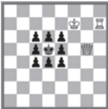
Wit geeft mat in 4