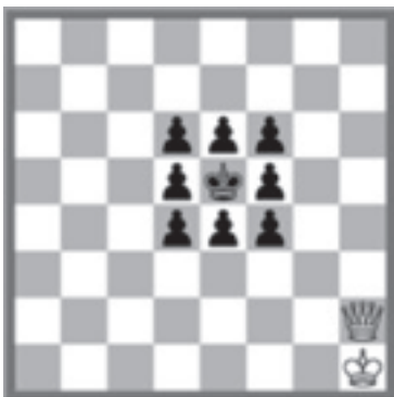
Wit geeft mat in 8