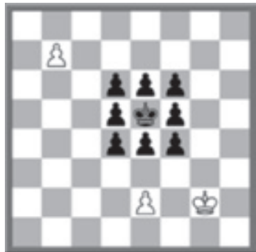
Wit geeft mat in 6