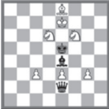
Wit geeft mat in 4